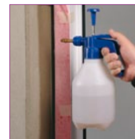
Před aplikací navlhčit podklad.

POZOR! Vlhčení se při teplotách pod bodem mrazu neprovádí!